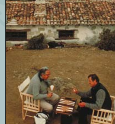
Roger Moore a producent Cubby Broccoli o přestávce mezi natáčením v klášterní oblasti Meteora.

KLÁŠTERY METEORA, POSTAVENÉ NA VRCHOLCÍCH ŘECKÝCH hor, byly v minulosti přístupné pouze pomocí lana. Proto se skvěle hodily jako úkryt pro zločince Arise Kristaltose. Když štáb dorazil na místo, aby se pustil do natáčení horských scén na Trinity Rock, narazil však agent 007 na zločince, kteří ve scénáři nefigurovali. Byli jimi mniši z Meteory. „Dopředu jsme si s církví v Aténách domluvili povolení natáčet v klášteře“, vzpomíná režisér John Glen, „ale platba za tyto služby se k místním mnichům nedostala, a tak odmítli spolupracovat. Místo toho zasahovali do filmování tým, že vyvěšovali prádlo a různé transparenty.“ Celý případ nakonec skončil u řeckého nejvyššího soudu, který rozhodl ve prospěch filmařů. Štáb, spolupracující na natáčení nové Bondovky, však musel okamžitě přijít s řešením, jak si s touto situací poradit. „Náš geniální kameraman si pro filmování vybíral úhly, ve kterých se objevovala pouze silueta kláštera a transparenty nebyly vidět,“ dodává Glen. „Na přilehlé skále jsme si pak vybudovali svůj vlastní klášter. Nemohli jsme si dovolit sedět s rukama za zády a čekat. Museli jsme najít řešení.“