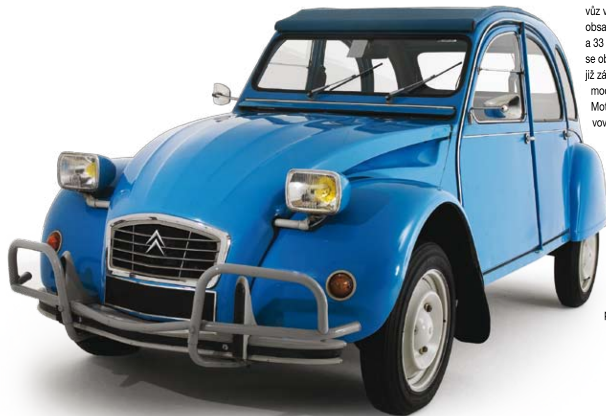
Model Citroën 2CV zůstal přes čtyřicet let, od roku 1978, prakticky beze změn.

V roce 1935 zadal Pierre Boulanger, ředitel společnosti Citroën, svému hlavnímu designérovi úkol, vytvořit automobil, který bude schopen uvést 2 osoby a 50 kg brambor o rychlosti 60 km/h a nespotřebuje při tom více, než 3 litry pohonných hmot na 100 km. Boulanger měl v úmyslu vyrobit levný automobil pro francouzské farmáře. „Je nutné, aby se s ním dalo jezdit po těch nejhorších cestách, a přitom to bylo dostatečně pohodlné,“ dodává. Výsledek byl nakonec představen v roce 1948 na Pařížském autosalonu a dostal název 2CV. Projekt Toute Petite Voiture (TPV - velmi malý automobil) byl přerušen během druhé světové války