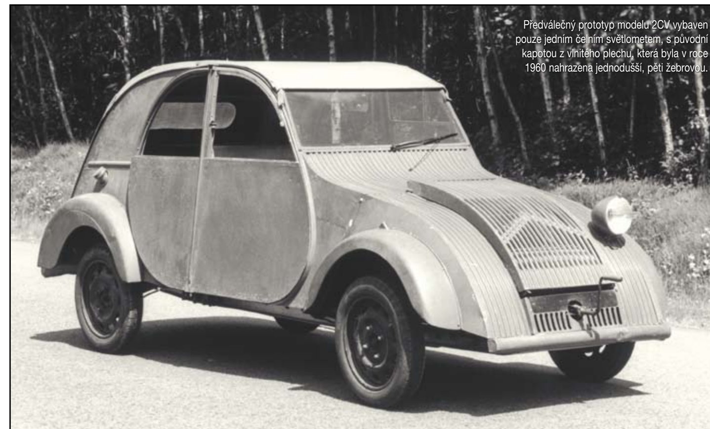
Předválečný prototyp modelu 2CV vybaven pouze jedním čelním světlometem, s původní kapotou z vlnitého plechu, která byla v roce 1960 nahrazena jednodušší, pěti žebrovou.

dělníkem. Postupem času však bylo 2CV překonáno modernějšími modely, a tak došlo k zastavení jeho výroby. Poslední model byl vyroben v roce 1990. Za dob jeho éry se prodalo 7,5 milionů kusů, což znamenalo, že tento „plechový slímák“ se nesmazatelně zapsal do dějin automobilového průmyslu.